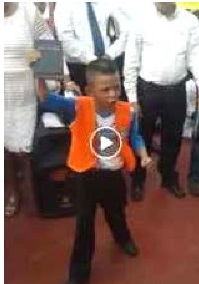
En los actos celebrados en la paradisíaca isla del caribe, este pequeño niño se convirtió en el centro del espectáculo.

“Hoy es un día muy especial por el motivo de celebrar el Día del Libro Sagrado. Hoy hace 30 años, en 1987, se declaró mediante decreto legislativo celebrar cada último domingo de septiembre este grandioso acontecimiento”; expresó el menor con voz de autoridad.