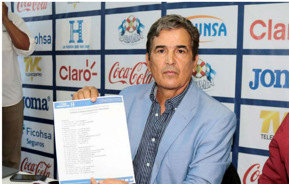
Honduras se mide a Costa Rica el seis de octubre en el Estadio Nacional de San José, capital tica.