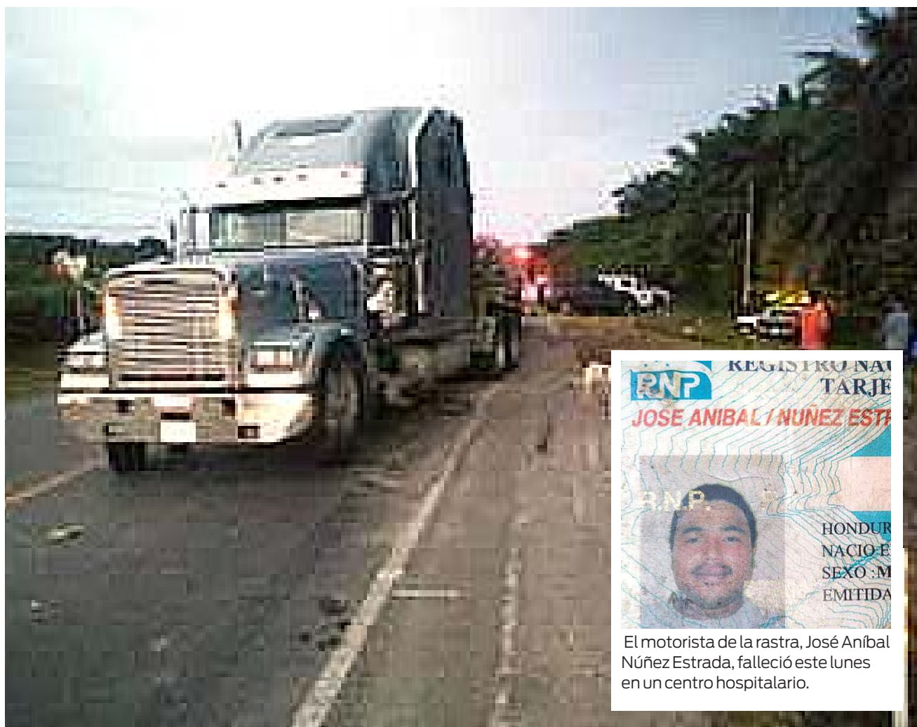
El motorista de esta rastra pereció ayer lunes. El accidente múltiple ocurrido en Tela el pasado domingo ya deja siete muertos.

Las investigaciones demuestran que los viernes y sábados es cuando más sucesos viales se registran. De igual manera se confirma que entre las 6:00 am y 9:00 am, así como también de 3:00 pm a 6 de la tarde es