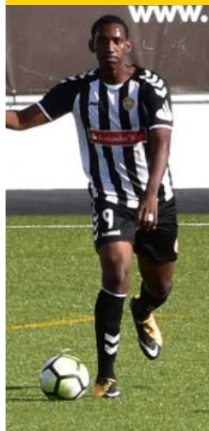
La tercera ronda de la Copa de Portugal se disputará el 15 de octubre y Nacional conocerá su rival mediante sorteo.

Entre tanto, el hondureño llegó al club a mediados de agosto procedente del Atlanta United de la MLS de Estados Unidos.