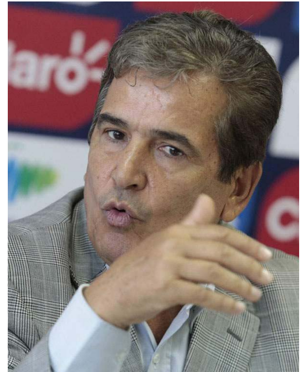
Pinto integrará a Carlo Costly a la convocatoria si se recupera.