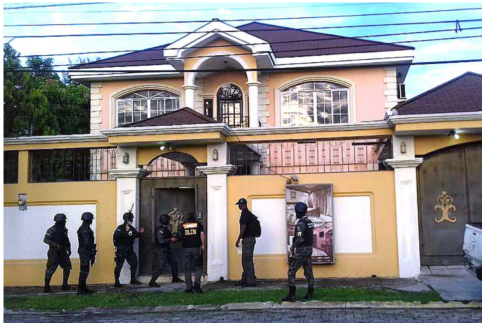
Esta es una de las residencias allanadas por el Ministerio Público en San Pedro Sula, Puerto Cortés y Olanchito.

Se ejecutan también medidas de aseguramiento sobre 131 bienes inmuebles y 11 sociedades mercantiles,