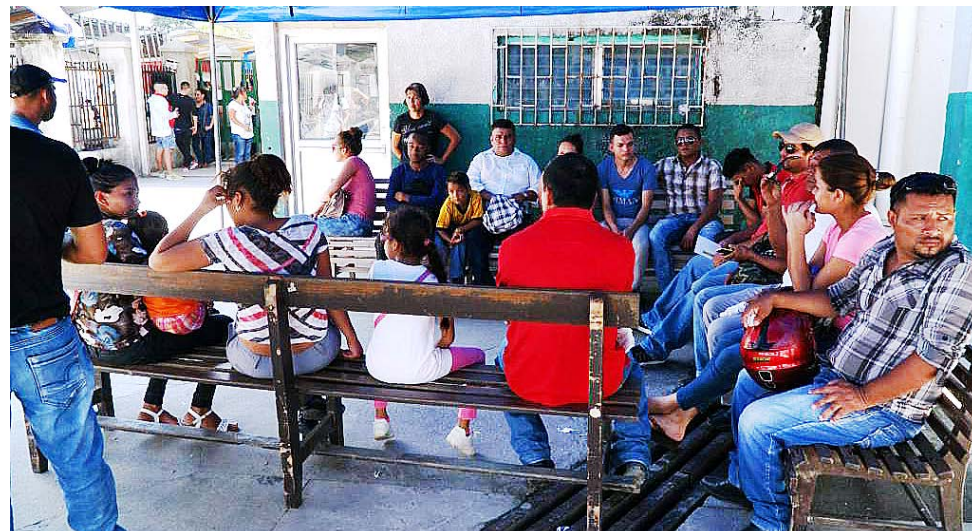
14 mil hondureños están sufriendo por esta enfermedad.

ñaló, que los padres deben tener suficiente cuidado con sus niños como lavarse las manos y el rostro, para poder evitar esta enfermedad en sus hijos.