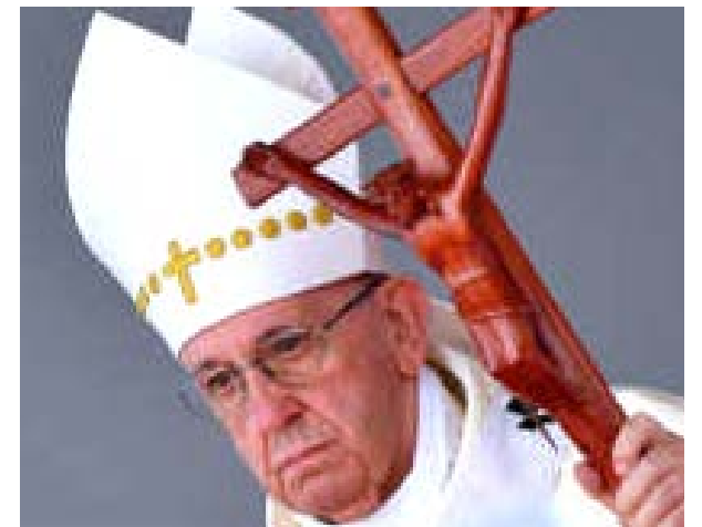
"Yo pienso que a México el diablo lo castiga con mucha bronca porque el diablo no le perdona a México que ella -la Virgen de Guadalupe- haya mostrado ahí a su hijo": Papa Francisco.

Ri también acusó al presidente estadounidense, Donald Trump, de haber "declarado la guerra" a Corea del Norte durante su discurso de la semana pasada ante la Asamblea General de la ONU, en la que el líder norteamericano amenazó con "destruir totalmente" al país asiático.