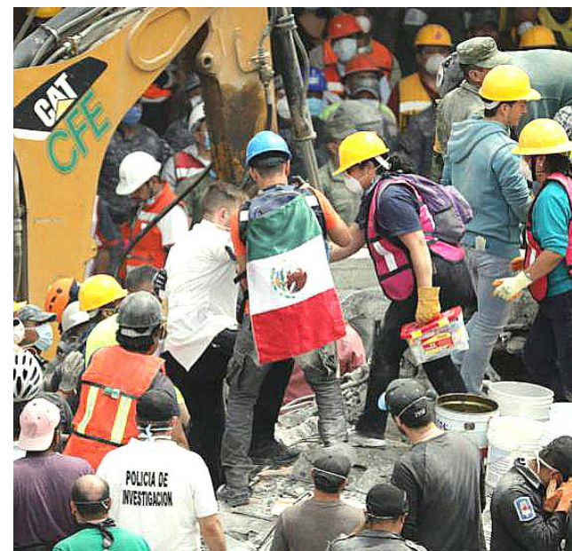
Las autoridades de la Fenafuth anunciaron que parte de la taquilla Honduras vs México será destinada a las víctimas del sismo en México.

Entre tanto, se determinó que un porcentaje de las ganancias sean para los mexicanos afectados.