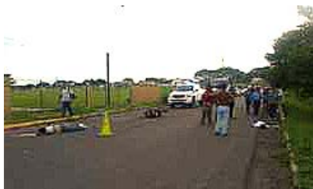
Uno de los hombres accidentados fue a parar hasta la orilla de la carretera.

Los tres cuerpos de las víctimas quedaron tirados en la carretera.